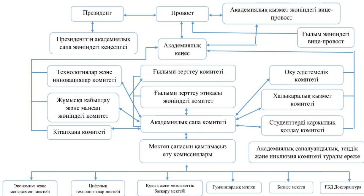
Сурет 2. Сапаны қамтамасыз етудің ішкі жүйесінің элементтері