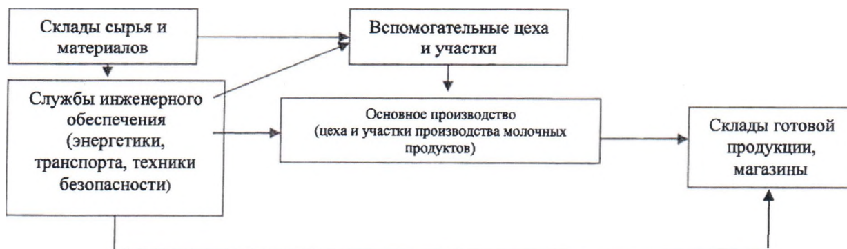
Рисунок 1. Производственная структура ТОО «Счастливый молочник»

Нумерация страниц отчета и приложений должна быть сквозной. Иллюстрации (чертежи, карты, графики, схемы, диаграммы, фотоснимки) следует располагать в отчете непосредственно после текста, в котором они упоминаются впервые, или на следующей странице. Иллюстрации могут быть в компьютерном исполнении, в том числе и цветные. На все иллюстрации должны быть даны ссылки в отчете.